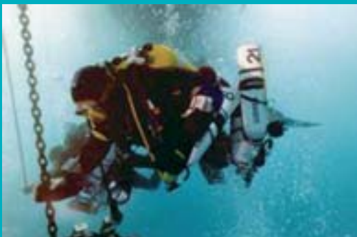
Subacqueo tecnico in fase di decompressione - UTR

L'attività subacquea viene praticata da molti decenni.